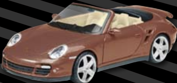
Vorserienmodell/pre-production sample/modèle de pré-série Porsche 911 Turbo Cabriolet 40 333 1029