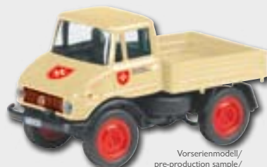
Vorserienmodell/ pre-production sample/ modèle de pré-série