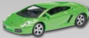
Lamborghini Gallardo 45 257 8000