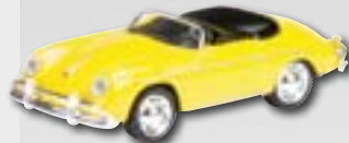
Porsche 356 A Speedster 45 257 7500