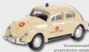
Vorserienmodell/ pre-production sample/ modèle de pré-série