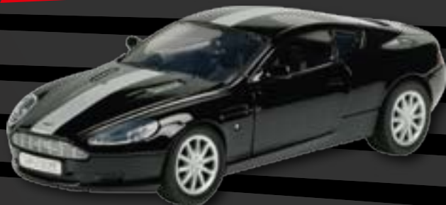
Aston Martin DB9