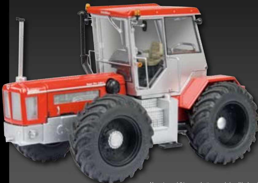
Vorserienmodell/pre-production sample/modèle de pré-série