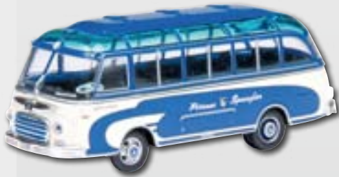
Setra S6 Bus „Spangler“