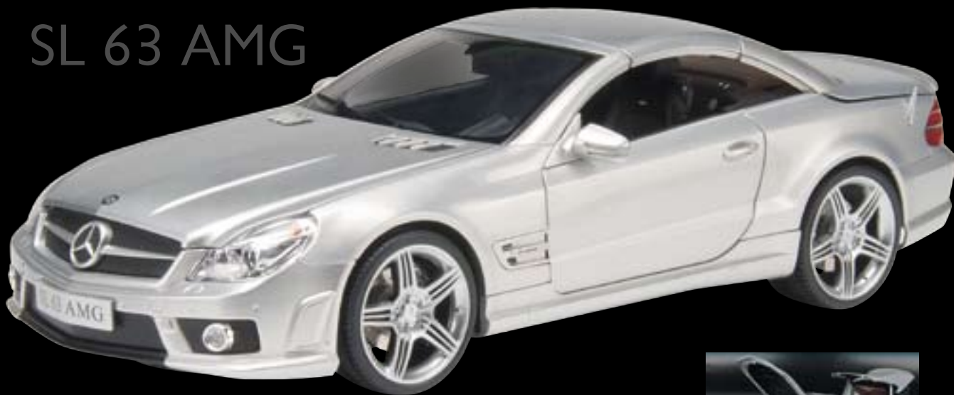
Vorserienmodell/pre-production sample/modèle de pré-série Mercedes-Benz SL 63 AMG 45 085 5000