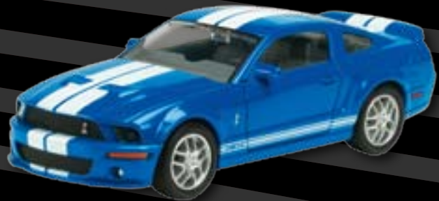
Shelby GT 500 40 333 1026