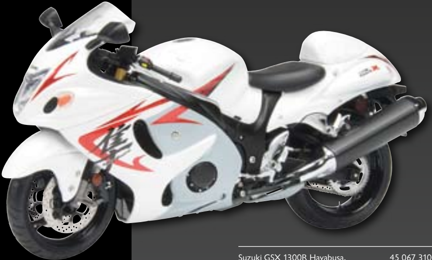
Suzuki GSX 1300R Hayabusa, weiß/white/blanc 45 067 3100