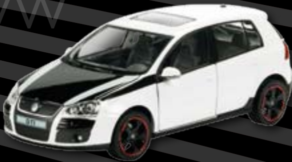
VW Golf V GTI 40 333 1027