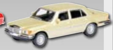
Mercedes-Benz S-Klasse Limousine 45 257 7400