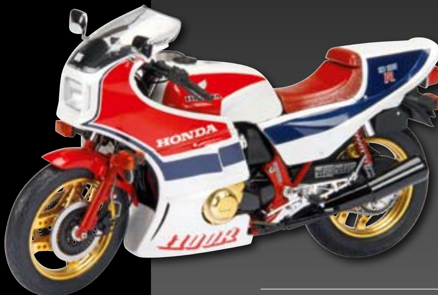
Honda CB 1100 RD 45 067 4000