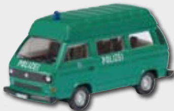
VW T3 Bus Hochdach „Polizei“ 45 257 8400