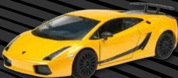
Lamborghini Gallardo Superleggero