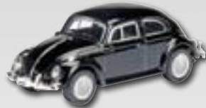
VW Käfer 45 257 7600