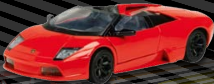
Lamborghini Murcielago Roadster