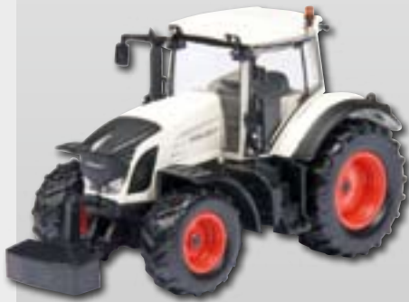
Fendt 936 Vario 45 256 8600