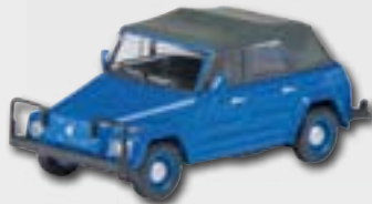
VW Typ 181 Kübelwagen 45 257 7700