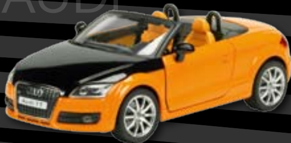
Audi TT Roadster