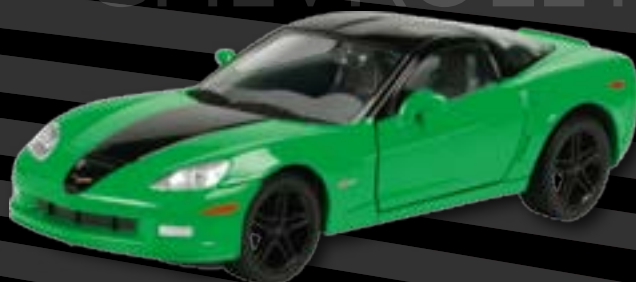
Chevrolet Corvette Z06