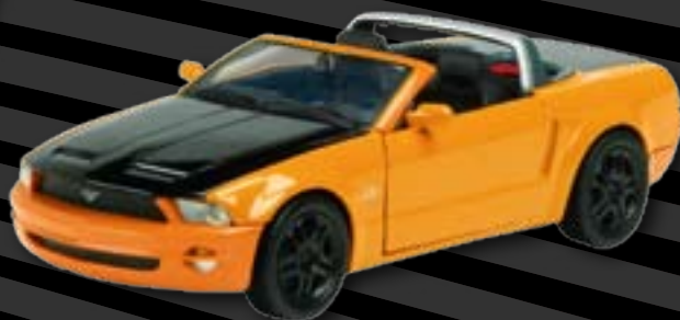
Ford Mustang GT Concept Convertible