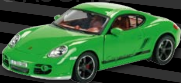
Porsche Cayman S 40 333 1025