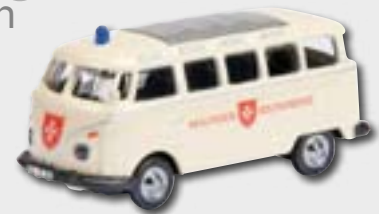
VW T1 Bus Samba „Malteser“ 45 257 8800