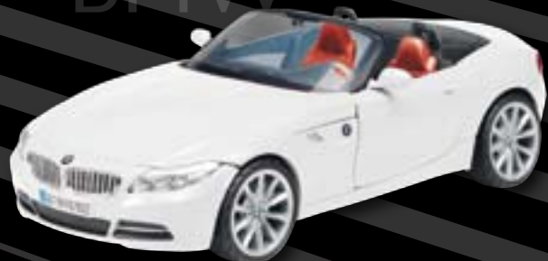
Vorserienmodell/pre-production sample/modèle de pré-série BMW Z4 40 333 1030