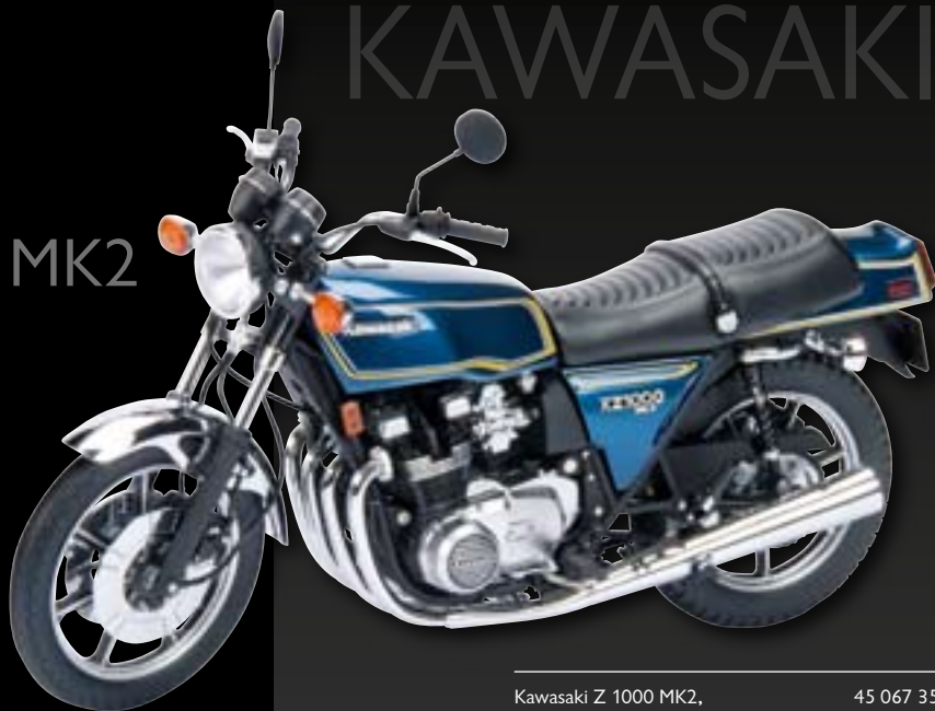
Kawasaki Z 1000 MK2, blau/blue/bleu