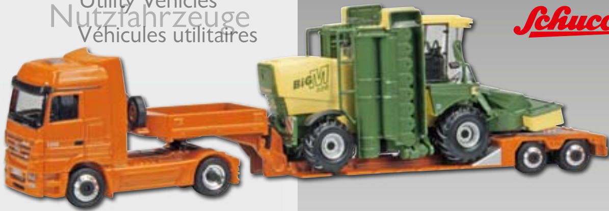
Mercedes-Benz Actros mit Tieflader/with flat-bed trailer/à remorque surbaissée und/and/et Krone BiGM 400