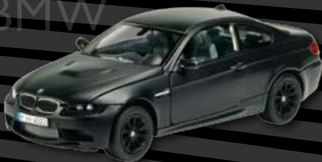
BMW M3 2008