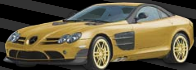
Vorserienmodell/pre-production sample/modèle de pré-série Mercedes-Benz SLR McLaren 40 333 1028