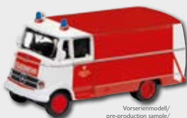
Vorserienmodell/ pre-production sample/ modèle de pré-série