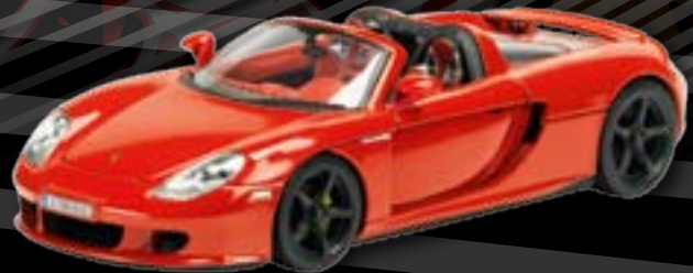
Porsche Carrera GT 40 333 1024