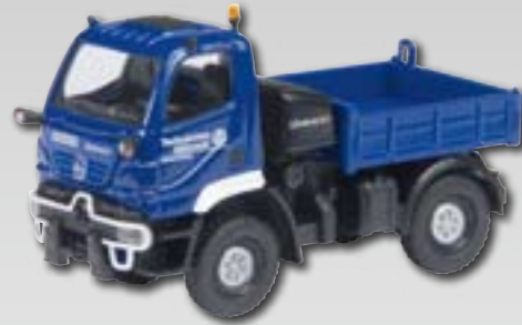
Mercedes-Benz Unimog U20 „THW“