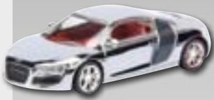
Audi R8, verchromt 45 257 8100