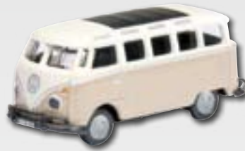
VW T1 Samba 45 257 7800