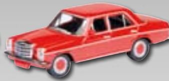
Mercedes-Benz -/8 Limousine 45 257 7300