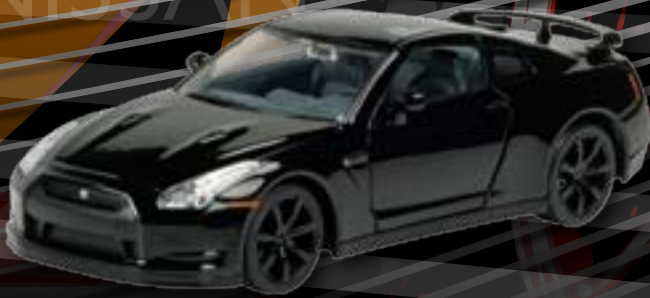
Nissan GT-R R35 40 333 1022