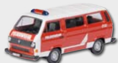
VW T3 Bus „Feuerwehr“ 45 257 8500