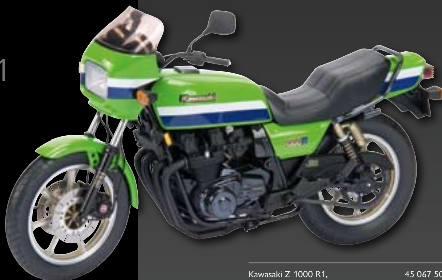
Kawasaki Z 1000 R1, grün/green/vert