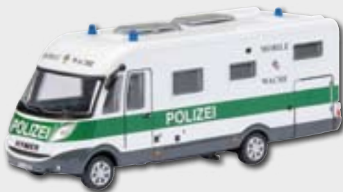
Hymermobil B-Klasse SL „Polizei“ 45 257 8300