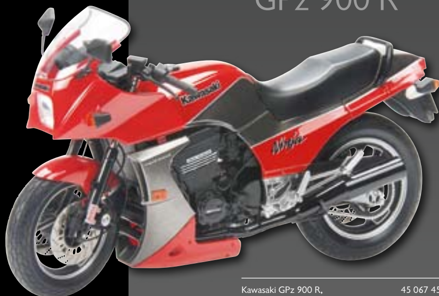
Kawasaki GPz 900 R, rot/red/rouge