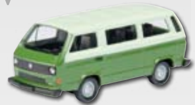
VW T3 Bus 45 257 7900