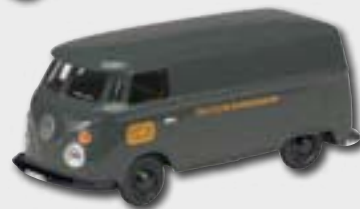
Set „175 Jahre Deutsche Bahn“