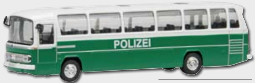
Mercedes-Benz Bus O 302 „Polizei“ 45 257 8200